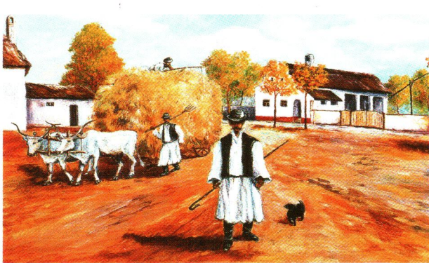
Torma Gyula alkotása