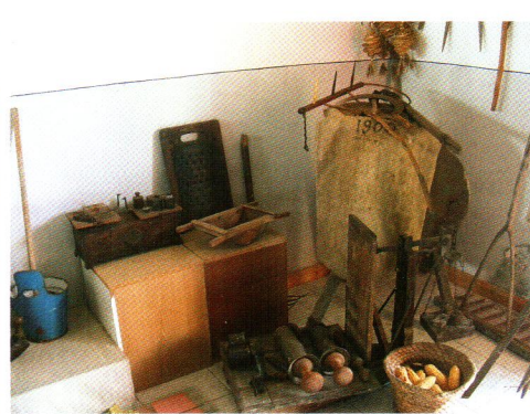
Helyismereti Gyűjtemény, részlet

A Mosoni-Duna lassan áramló víz, partjain galériaerdők húzódnak, ez a vízitúrázók paradicsoma: csónakázók száza veszik igénybe nyaranta az önkormányzat által kiépített, tűzrakásra is alkalmas táborhelyet. A gát-hoz közeli országút könnyű vízre szállási lehetőséget biztosít az evezősöknek. A Bányató és a Morotva, mely a község keleti szélén