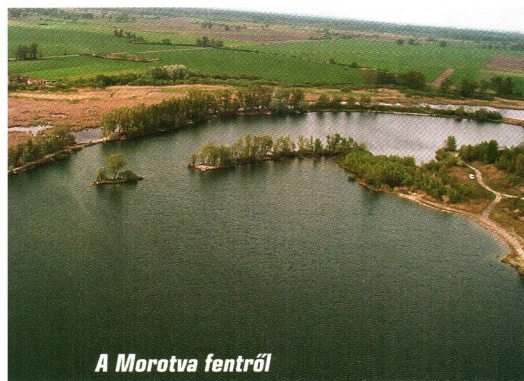
A Morotva feletről