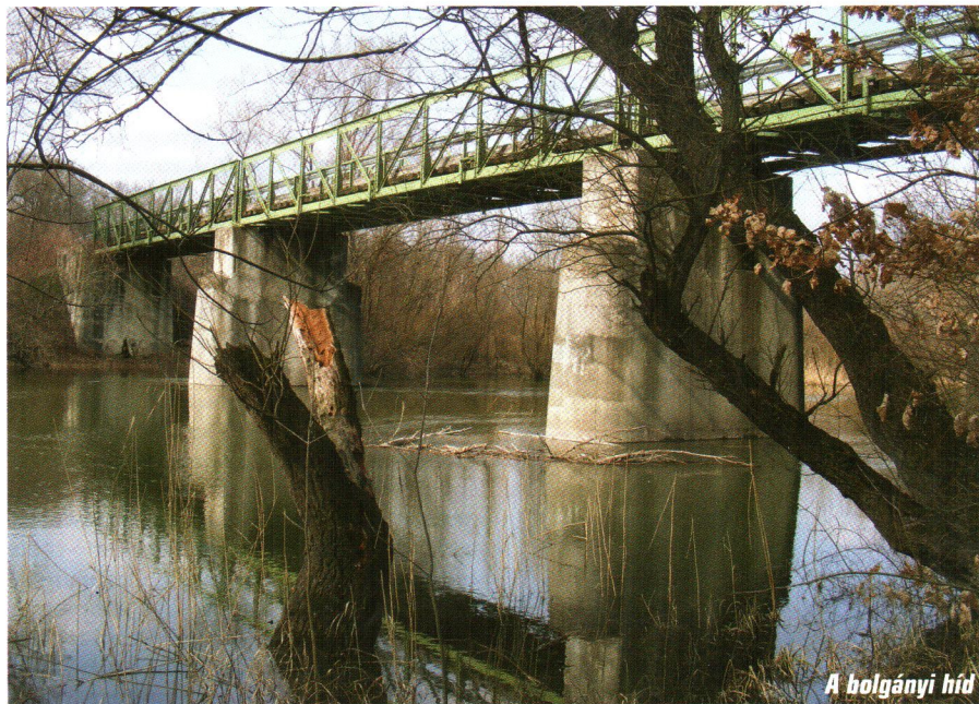
A bolgányi híd

A tájékozódás során persze sok más is kiderült: Dunaszegen egy ritka technikai gyűjtemény is található, és ez nem más, mint a népnyelven csak „csettegőnek” vagy „csühögőnek” nevezett lokomobilok, stabilmotorok bemutatója a régi tűzoltószertár mögött épített tárolóban. Az emberek általában a régi cséplőgépeket szíjátétellel meghajtó gépezetre emlékeznek igazán, ám ezek a kisebb-nagyobb csühögők sok egyéb munkaeszközt is hajtottak annak idején: szivattyút, fűrész, darálót, áramfejlesztőt, szecskavágót. Roppant nehéz szerkezetek, sokat csak lovakkal lehetett a munkavégzés helyszínére vontatni, míg teljesítményük nem